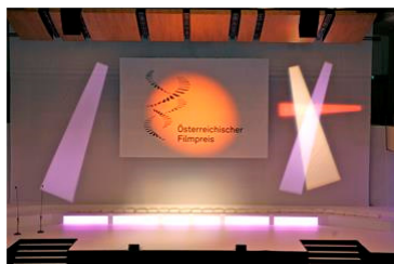
Österreichischer Filmpreis 2014, Grafenegg

Die 6. Verleihung des Österreichischen Filmpreises findet am 20. Jänner 2016 in Grafenegg in Niederösterreich statt.