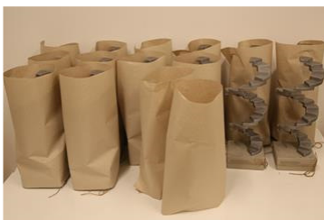
Preisskulpturen von VALIE EXPORT